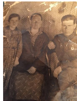
С мамой и сестрой