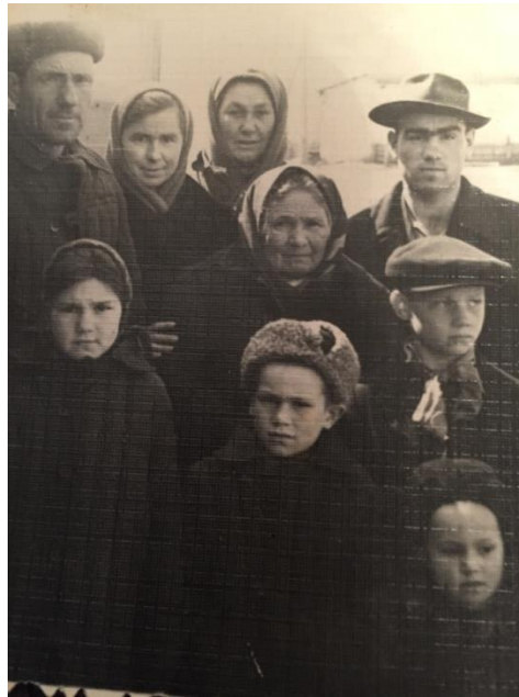
В кругу своей семьи