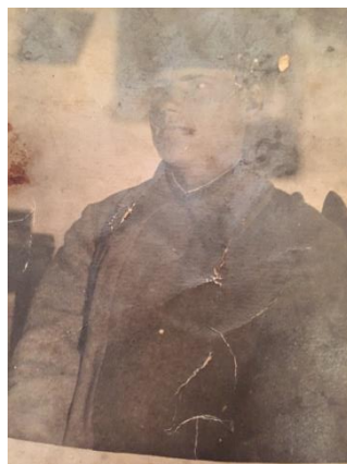
Солдат Красной Армии