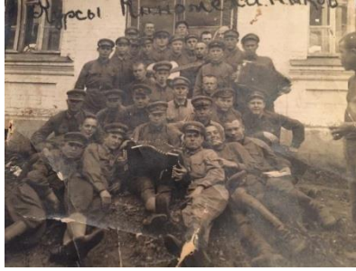
На курсах киномехаников