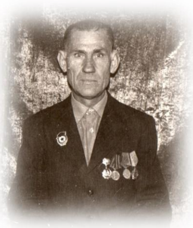
В послевоенные годы